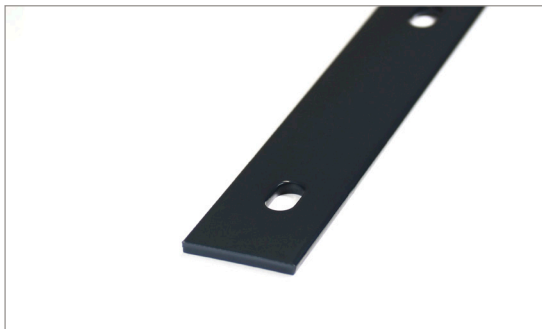
Abb.: sendzimirverzinkt RAL 7016